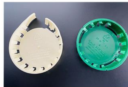
Deckel unbekannt in beige & grün

Nur Deckel aus hartem Plastik mit Schraubverschluss und den Angaben können genutzt werden. Vielen Dank für Ihre Mithilfe! 😊