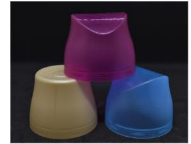
Wäschemittel-/Wäscheperfum- deckel ohne Drehverschluss