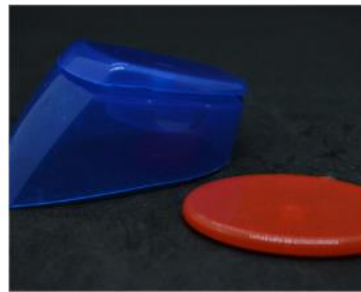
Duschmitteldeckel ohne Schraubverschluss